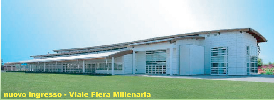
nuovo ingresso - Viale Fiera Millenaria